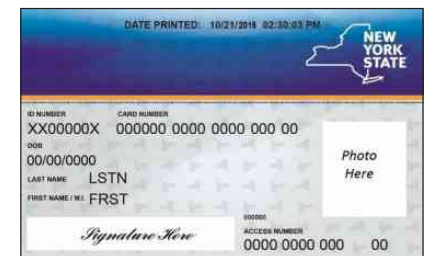
Nouvo Kat Medicaid